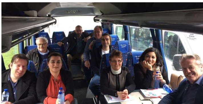
Bus tour Accio langs de woningvoorraad van Talis, maart 2017

Ook zal Accio in de 2 e helft van 2017 andere beleidsthema's voor beïnvloeding in kaart brengen, zoals op het gebied van sociale veiligheid en dienstverlening. Accio zal daarover in contact treden met de leden (en met Talis) om thema's te kunnen inventariseren en voorrang te geven. Het oppakken van aanvullende beleidsthema's is mede afhankelijk van de betrokkenheid/deelname vanuit de leden en van de beschikbare capaciteit van het Accio-bestuur. Ook zal, waar zinvol, gekeken worden naar thema's die spelen in de landelijke woonagenda's.