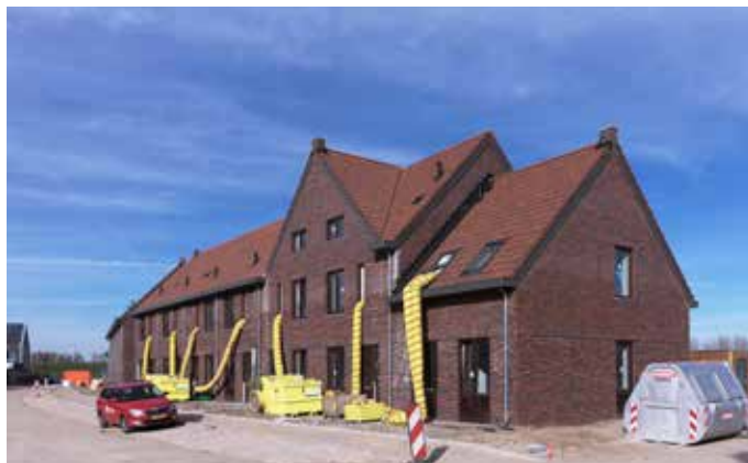
De nieuwe woningen van Talis in Grote Boel.