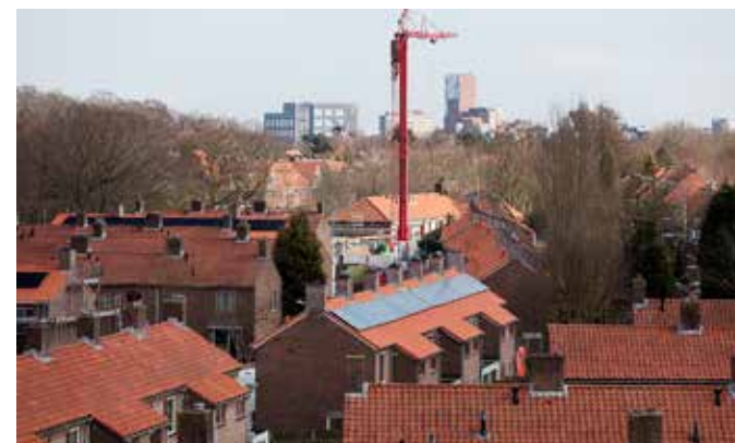
In de Kolpingbuurt wordt gesloopt en gebouwd.