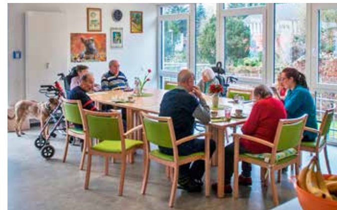
Bewoners mogen zelf bepalen hoe ze willen wonen.