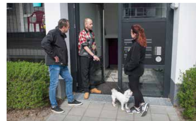
De wijkbeheerders maken met iedereen een praatje.