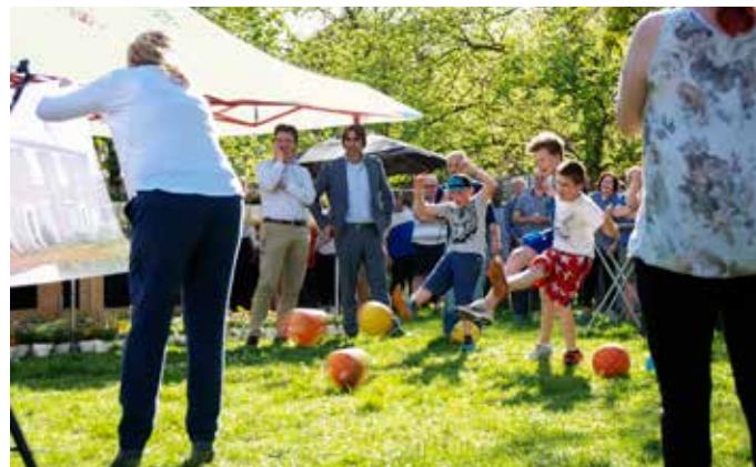
Met de hele buurt werd de start van het onderhoud gevierd.